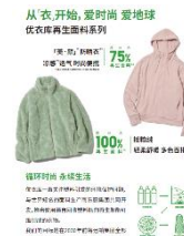
〈例:ユニクロ展示商品〉

・内 容:各モールの館内共用部にて、専門店とコラボレーションし、環境配慮型商品や、健康的な環境で生産された商品などを展示します。期間中に参加専門店で購入したレシートのご提示で、特典をご用意します。